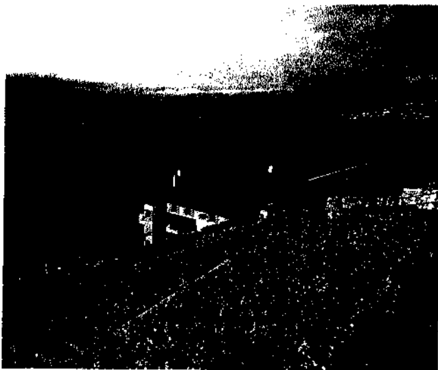
Le Clos des Abbayes.

L'analyse des résultats de la mise entre les régions de La Côte et du Lavaux est également intéressante. En effet, pour la Côte, malgré un résultat en légère hausse, il reflète bien l'état du marché. Le volume, sensiblement inférieur à