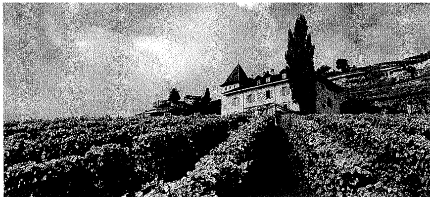
Domaine de Burignon

reté de cette appellation prestigieuse, les prix pourraient bien prendre l'ascenseur!